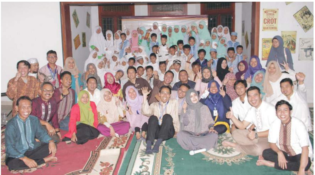
BIJB Berbagi Bersama Anak Yatim