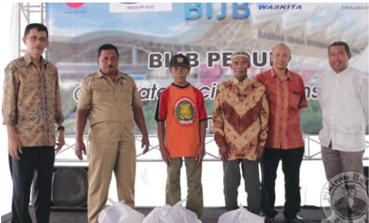
BIJB Peduli – Berbagi Sembako