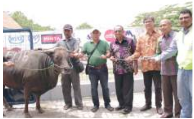
BIJB Tebar Berkah Qurban 2016