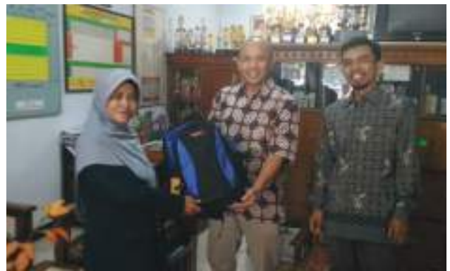
BIJB Peduli – Sumbangan Sosial