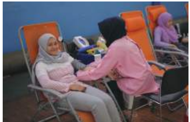
BIJB Tebar Berkah Qurban 2016