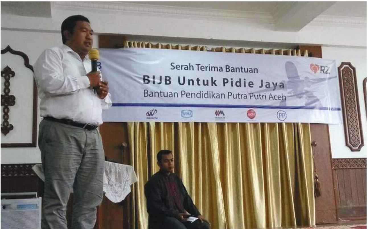
BIJB Care – Disaster at Pidie Jaya, Aceh