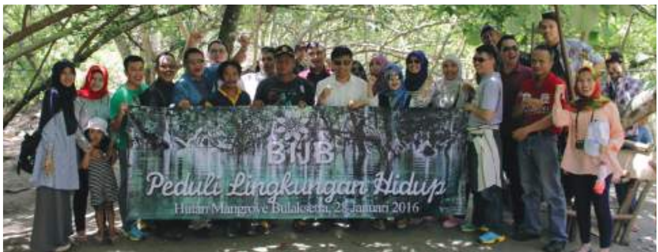
BIJB Peduli Lingkungan